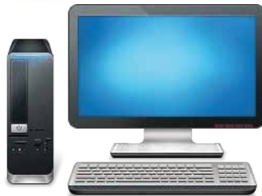
PC DE CONTROL